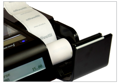
Inserimento rapido e agevole del rotolo carta