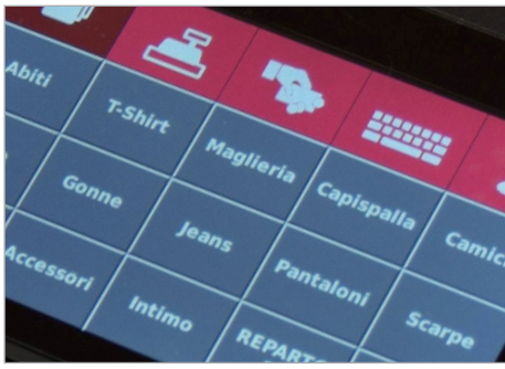
Tastiera touch screen configurabile, immediata ed intuitiva